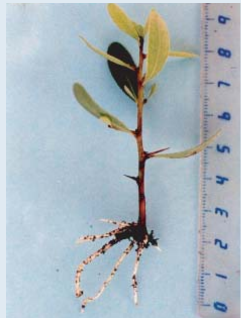
Tableau 1: Enracinement, production de cals et pourriture des boutures d'arganiers, 4 mois après le bouturage

Les travaux ont été menés à l'Institut Agronomique et Vétérinaire Hassan II d'Agadir par une équipe de chercheurs du Département de l'Environnement. Les essais ont été conduits dans une serre à environnement contrôlé de façon informatisée avec une humidité relative de l'air supérieure à 60 % et une température de l'ordre de 30 °C. Les artifices utilisés pour s'approcher le plus possible de ces conditions sont la brumisation, l'ombrage et l'aération. Des boutures de tête de 5 cm de longueur ont été prélevées sur différents rejets d'arganiers et effeuillées à la base pour dégager la partie du rameau à insérer dans le substrat. Elles ont ensuite été disposées dans des plateaux alvéolés contenant un mélange de 50 % de tourbe noire et 50 % de sable grossier. Plusieurs essais ont été entrepris afin d'évaluer l'effet de la saison de bouturage ainsi que celui de l'AIB (acide indol-butérique) sur la rhizogénèse. Pour la saison, un essai a été effectué le 25/12/97 et un autre le 14/05/98. Pour le traitement à l'AIB, 4 concentrations ont été utilisées: 0 (eau distillée, témoin), 500, 1000 et 2000 ppm. Les boutures ont été trempées pendant 5 secondes dans la solution et mises dans le substrat. Les observations ont concerné le pourcentage d'enracinement, la production de cals, l'impact de la pourriture et la production de la