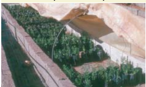
Acclimatation des plants

L'arganier est une plante à usages multiples, qui, au cours de son évolution a pu développer des caractères assez spécifiques qui lui ont permis de s'adapter aux conditions climatiques sévères de son aire de distribution, particulièrement étendue. C'est pour cela qu'il se présente avec des populations ayant des caractéristiques différentes. En effet, en fonction des conditions édapho-climatiques locales, l'arganier est capable de développer certains attributs génétiques qui lui permettent de se maintenir malgré la sévérité des conditions. Cependant, les populations riveraines usufriétaires, le développement rapide de l'agriculture moderne et les extensions urbaines menacent son existence. La conservation de l'arganier est une priorité qui n'est plus à démontrer pour le maintien de l'équilibre écologique de la région; surtout que c'est la seule formation arborée qui existe en climat aride. Toutefois, cette conservation serait plus efficace par la valorisation de caractères désirables comme la teneur en huile, la valeur fourragère ou la tolérances aux stress abiotiques dont la reproduction ne peut être réalisée que par multiplication végétative dont le bouturage représente la pratique la plus simple.