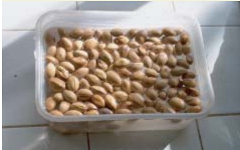
Stratification des graines dans l'eau