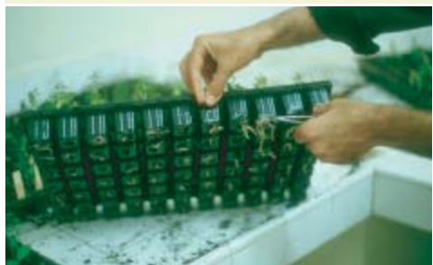
Habillage des racines