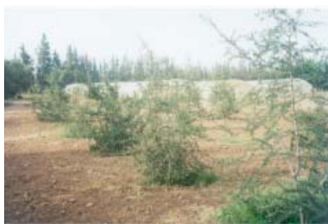
Transplantation au champ