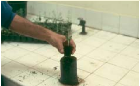
Transplantation en pot