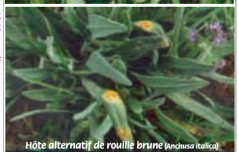
Hôte alternatif de rouille brune ( Anchusa italica )