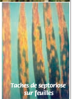
Taches de septoriose sur feuilles

Pour germer, les pycnidiospores ont besoin d'eau libre sur les feuilles. Après germination, le champignon colonise le tissu foliaire via les stomates ou directement à travers l'épiderme. L'humidité est indispensable pour tous les stades d'infection: germination, pénétration, développement du mycélium dans le tissu foliaire et formation des pycnides. Ces derniers sont capables dès leur formation d'exsuder les pycnidiospores dans un cirrhe transparent. Le cirrhe correspond au mélange de spores dans une gelée mucilagineuse protectrice. Chaque pycnide peut produire plusieurs milliers de spores. A la faveur d'alternances d'humidification et de dessèchement, il peut y avoir plusieurs émissions de cirrhe par une pycnide donnée.