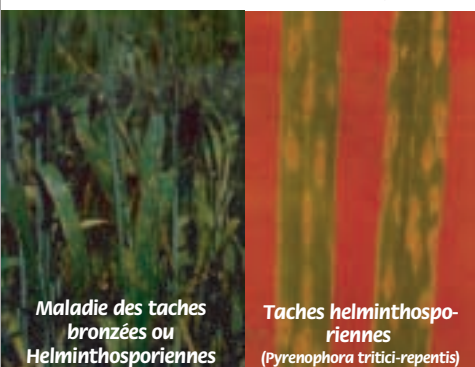
Maladie des taches bronzées ou Helminthosporiennes

L'agent pathogène se conserve sous forme de spores et de mycélium sur les résidus du blé infecté à la surface du sol. Sur les chaumes, les périthèces