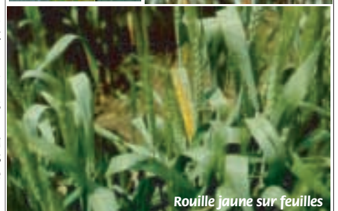
Rouille jaune sur feuilles