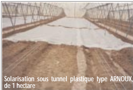
Solarisation sous tunnel plastique type ARNOUX, de 1 hectare

concentration du Métam sodium dans l'eau d'irrigation doit être d'environ 1%. Après l'application totale du Métam sodium, continuer l'irrigation jusqu'à la dose de 100 m 3 par hectare. L'eau d'irrigation va permettre la diffusion du Métam sodium dans le sol. Après cette irrigation, il faut procéder à la couverture du sol avec le film plastique transparent de 40 µ d'épaisseur pour la solarisation.