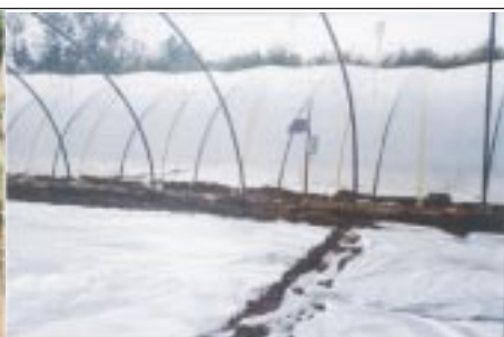
Solarisation en plein champ (premier plan) et sous tunnel plastique (arrière plan)

La faisabilité technique et économique des alternatives disponibles dans les conditions marocaines a été évaluée durant les deux campagnes agricoles 1998-99 et 1999-2000, au niveau des principales zones de production de tomate (Souss Massa et région d'El Jadida). Ces techniques alternatives sont utilisées pour lutter contre les principaux ravageurs et maladies concernés par la désinfection du sol de tomate au bromure de