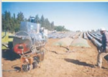
Traitement à la vapeur avec chaudière ambulante (essais sur fraise)