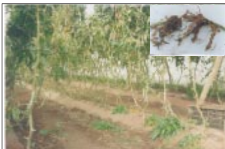
Dégâts de nématodes sur tomate sous serre. En médaillon, les symptômes sur racines de tomate

méthyle, commencé en 1997, arrive à sa fin cette année avec des résultats plus que satisfaisants;