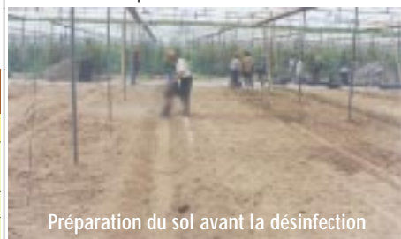
Préparation du sol avant la désinfection

Programme National de Transfert de Technologie en Agriculture (PNNTA), DERD, B.P: 6598, Rabat, http://agriculture.ovh.org Bulletin réalisé à l'Institut Agronomique et Vétérinaire Hassan II, B.P:6446, Rabat, Tél-Fax: (7) 77-80-63, DL: 61/99, ISSN: 1114-0852