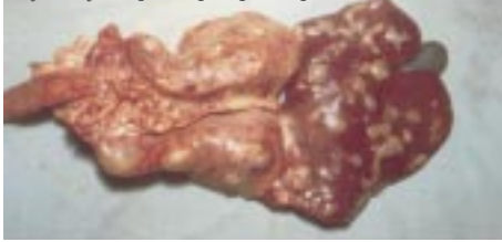
Kystes hydatiques hépatiques et pulmonaires (Nbaïl)

Cette maladie constitue un problème de santé public majeur puisqu'elle est commune à l'homme et aux animaux. Elle se manifeste par la présence de kystes localisés essentiellement dans le foie et les poumons. Ces kystes sont remplis d'un liquide clair sous pression qui augmentent de taille avec l'âge de l'animal. Le taux d'infestation des jeunes par la maladie atteint 50%; celui chez les brebis dépasse 90%.