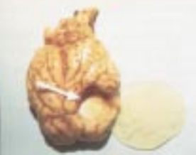
Larve de Coenure dans le cerveau

Cette maladie est due à la localisation dans les centres nerveux du mouton de vésicule flasque contenant la larve de coenure appelée Coenurus cerebralis . Cette vésicule exerce une pression sur les tissus nerveux et entraîne des troubles locomoteurs avec déplacement en cercle "tourmis", station debout difficile, paralysie et attitudes particulières comme flexion de la tête sur l'encolure "tête encapuchonnée" ou en arrière "cingleur".