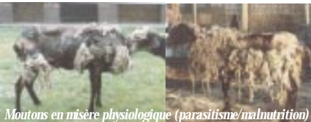
Moutons en misère physiologique (parasitisme/malnutrition)

Pendant les périodes sensibles, l'effet pervers parasitisme/malnutrition conduit au déséquilibre et place le parasitisme en situation de facteur limitant, si l'éleveur n'intervient pas.