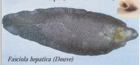
Fasciola hepatica (Douve)

Globalement, la fasciolose animale, connue aussi sous le nom de la douve, se déclare en deux périodes: en fin printemps et en automne.