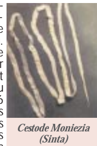
Cestode Moniezia (Sinta)

Connue aussi sous l'appellation de taeniaisis, elle constitue une des dominantes pathologiques chez l'agneau. Le parasite responsable appelé Moniezia est un ver plat en forme rubanée; vit dans l'intestin grêle du mouton et peut atteindre 6 mètres de longueur. Les anneaux mûrs contenant les œufs embryonnés sont rejetés dans le milieu extérieur avec les excréments où ils peuvent apparaître sous forme de "grains de riz" tapissant la zriba ou la bergerie, souvent suite au traitement. La lyse de ces anneaux libère des œufs qui seront ingérés par un hôte intermédiaire indispensable au développement: l'oribate. Ces acariens coprophages de 1 mm de long vivent sur le sol ou sur l'herbe particulièrement dans les prairies humide, acides et riches en humus. Le petit ruminant s'infeste en absorbant l'acarien porteur de la larve.